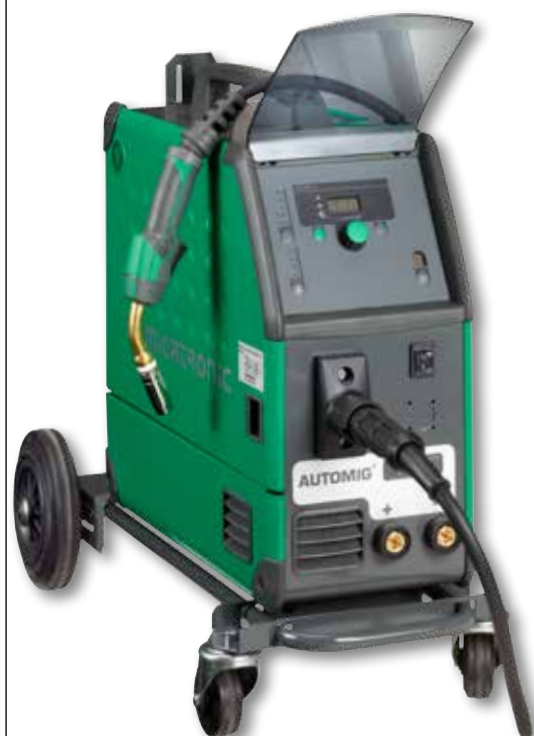
Automig 2 273i na vozíku