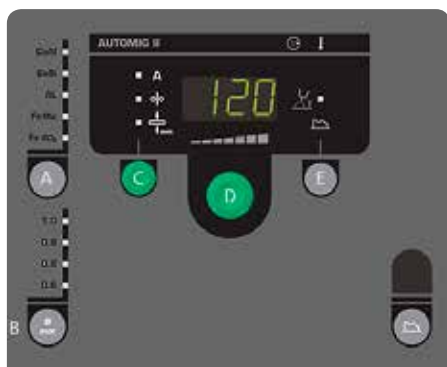
Panel Automig II